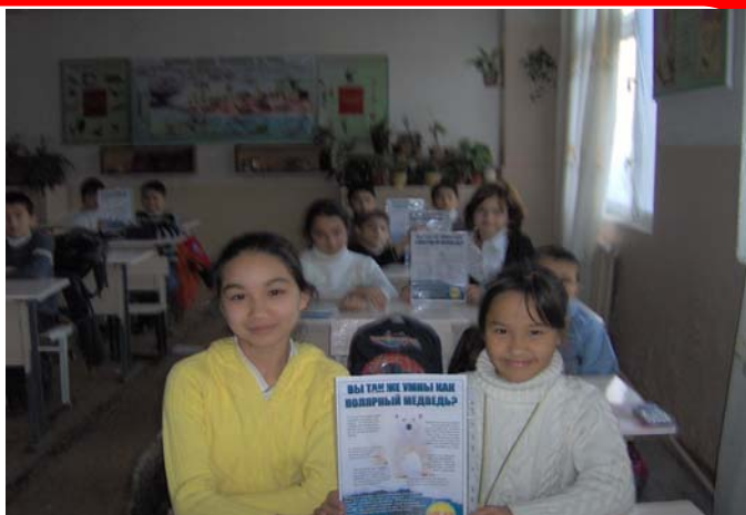
на фото: ученики школы - участники Дня энергосбережения в Узбекистане

энергетической викторины, где участники решали какими способами можно сохранить тепло в доме, и каким образом лучше всего избавляться от отходов. День энергосбережения в лицее прошел весело и интересно. Расставаясь, ученики и учителя договорились более тесно обмениваться информацией и вместе работать над совместными программами.