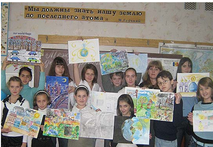
на фото: конкурс рисунков в лицее имени Н.М. Спэтару, Кишинев, Молдова

В этот же день в лицее имени В. Лупу принимали гостей - учащихся и педагогов из школ города Черкассы, Украина. Члены экологического клуба «Discovery», действующего при лицее, рассказали украинским ребятам о своей работе в области энергосбережения, поделились информацией о проекте SPARE. На встрече были представлены выступления преподавателей и презентации самих школьников. Бурные обсуждения завязались в ходе