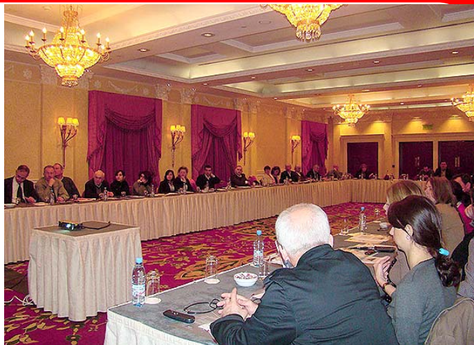
на фото: участники конференции в Грузии

15-16 ноября в Тбилисском государственном университете прошла встреча, где обсуждались вопросы глобального изменения климата и энергоэффективности. Во встрече приняли участие студенты и преподаватели различных факультетов. В рамках мероприятия эксперты из организации «ЭкоВзгляд» сделали презентации, посвященные глобальному изменению климата, энергетической ситуации в Грузии и доступным энергосберегающим мерам. Помимо этого присутствующие смогли понаблюдать за практической работой по утеплению окон в одном из лекционных залов университета.