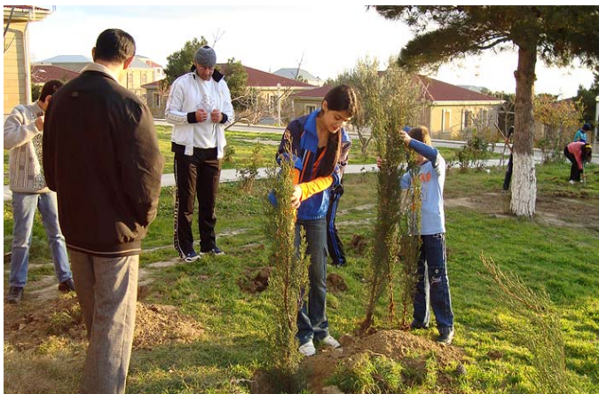
на фото: ребята принимают участие в акции «Пусть каждый посадит дерево» в Азербайджане

А в пригороде Баку, СМА провел демонстрационную акцию по утеплению окон в общеобразовательной школе N255, поселка Маштаги. Здесь, ученики и учителя, вовлеченные в SPARE, заменили стекла и утеплили окна в кабинетах физики и географии. В свою очередь, администрация школы выразила признательность организаторам мероприятия и отметила, что такие акции очень важны для повышения сознания широкой общественности в области бережливого использования энергоресурсов.